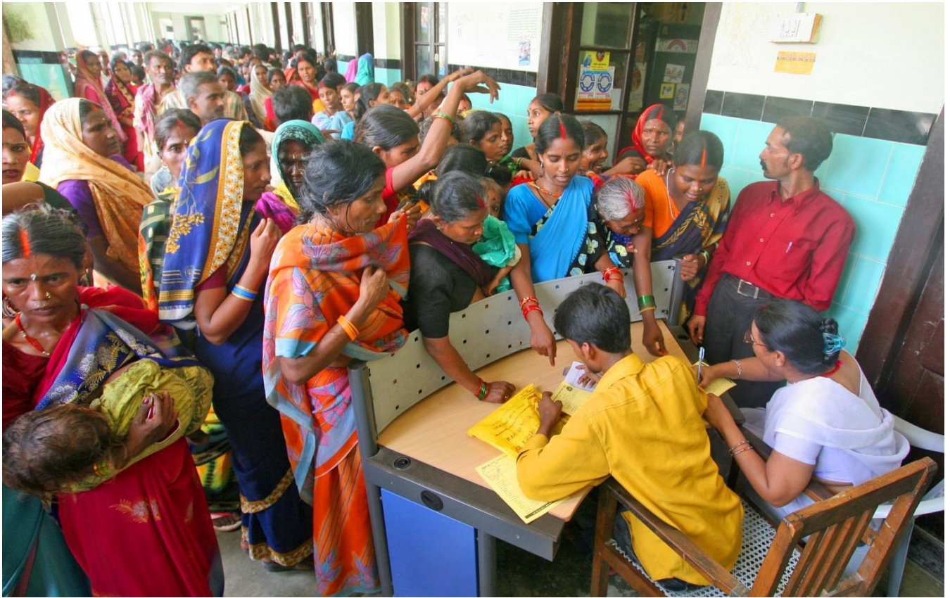
People waiting to get registered at Motihari District Government Hospital in East Champaran, Bihar, India. With so few doctors employed to work in the healthcare sector in India, this scene is typical. (2009)